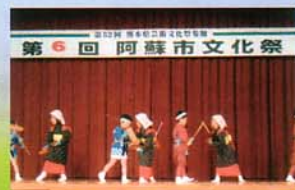
YMCA尾ヶ石保育園 園児の虎舞