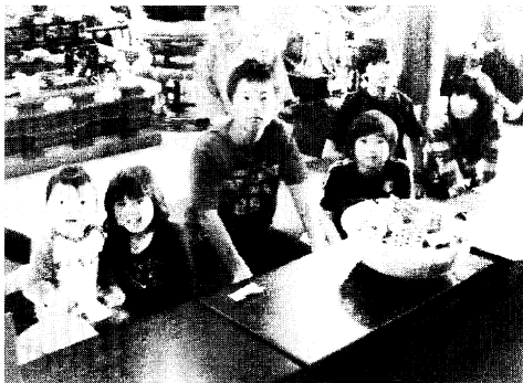
子供特別福引参加の子供たち