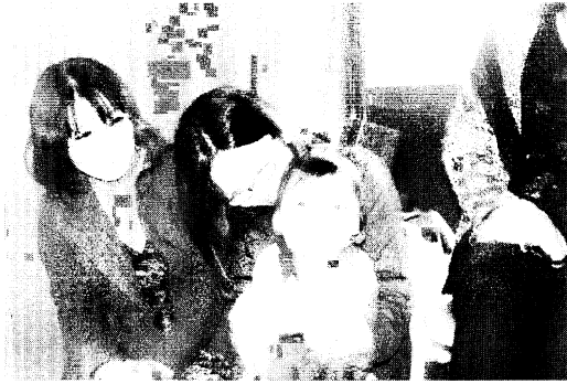
祖母、母、孫三代でお詣り②

の団扇太鼓の中厳修されま した。 鬼子母神大祭は、お子様 も小さな手を合せ一生懸命 にお参りし、怖い形相をし た鬼子母神様を不思議そう に眺めている姿もありまし た。この大祭がご縁で未来 のお寺を担っていくお子様 もいるのではないでしょう か。心強く思います。 お上人様の木剣の音高々