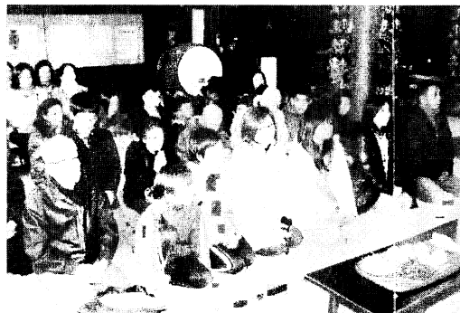
新年祝禱会参詣の方々