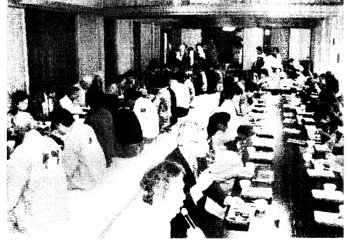
手作りのおときをいただく

今年は何年にもないパフォー マンスも取り入れられ、本 堂の正面入り口に掲げられ た五本の「のぼり旗」に染 め抜かれた、「圓頓寺大黒 さまくらしの五徳」を副住 職が朗読、解説され、世話 人の方が打ち出の小づちを 五回大きく回されました。 その後世話人の方が景気づ けにお神酒を口に含まれ、 準備万端整い開始です。 最初は、全員空くじなし