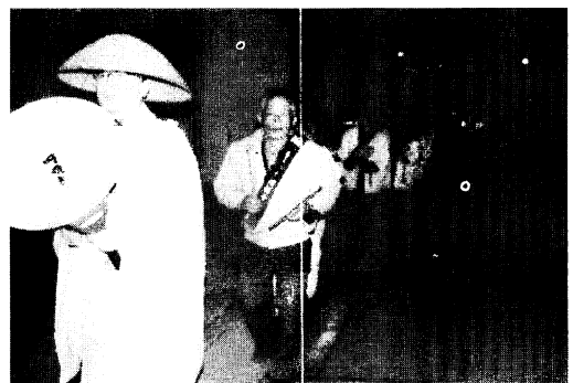
副住職を先頭に寒修行