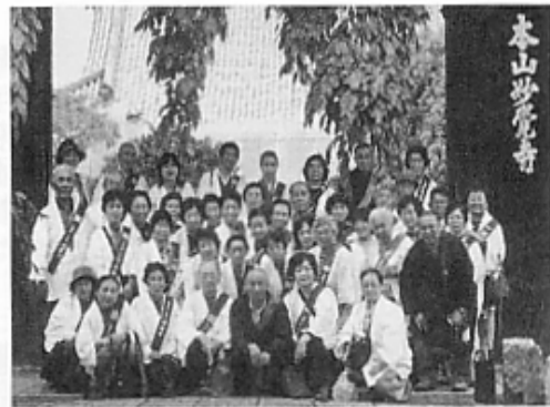
洛中本山・妙覚寺にて

翌朝は朝のお勤めのために暗いうちから宿坊を出ました。気になっていた天気はくずれましたが、白々と夜が明ける中に総本堂は雨に煙っていました。静まりかえった境内に佇みながら、身の引き締まる何かを感じました。朝のお勤めには、檀信徒の方々数百人の読経が本堂に響き渡って、身が震え感動を覚えました。滋賀の八幡山の村雲御所・瑞龍寺は、明治二十年以来圓頓寺に関わりが深い寺院だとお聞きして、交流の歴史を感じました。