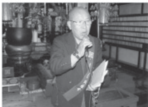
初講で挨拶する鬼木会長