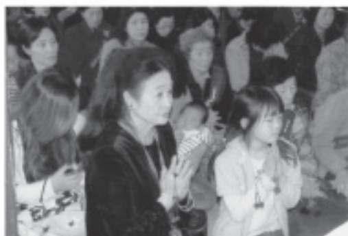
お祖母ちゃんと一緒に合掌

をなさって、修行中のことを具体的にお話になり、苦行を乗り越えられました。今まで一般の会社にお勤めになり、色々の体験をなさっているのです、違った角度から黄泉道の道を極められるでしょう。お上人は必ず立派な指導的立場なられるお方だと思えます。どうか、今後ご精進なさいまして、私共をお導き下さいませ。