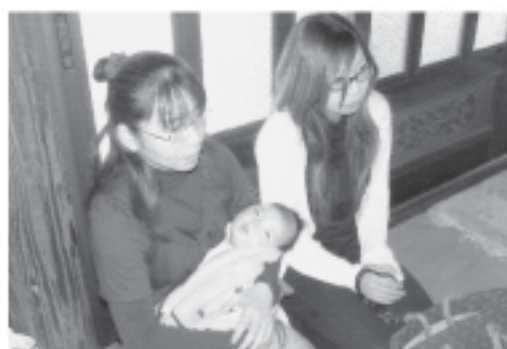
赤ちゃんもお詣り

の時神仏の存在を確認出来たのではないのでしょうか。修行中に、自分の心の中にある三毒（貪り、怒り、愚痴）を出し切ってしまったわなければならぬ。法華経は『生きとし生けるものすべて成仏すると云う』素晴らしい教えである。自分に辛くあたる人が自分のより良き指導者である。とお話になりました。苦修練行の行