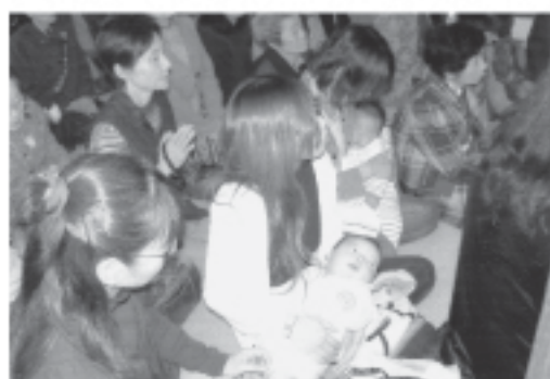
抱っこされてお詣り

回お粥と味噌汁、水行一日七回、睡眠は二時間三十分ほど、その他は読経三昧の毎日です。空腹、睡眠不足、寒さで心は極限状態になり、色々の妄想が浮かび上がります。そんな中、三週間目くらいの時、修行僧様方の読経の音が美しい女性の歌声の響きに替わり、今までの辛さが嘘のように晴れやかな気持ちになりました。こ