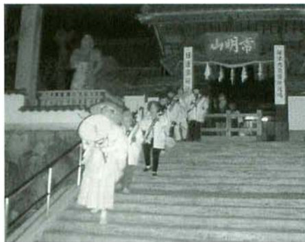
寒修行お寺を出発