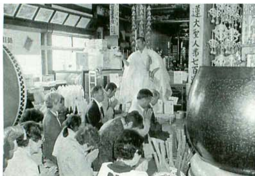
祈祷を受ける檀信徒