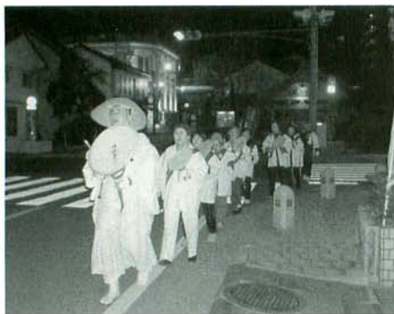
夜の街を行く寒修行