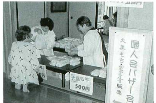
婦人会「大黒もち」のバザー

私共婦人会は一日から餅米洗い、餅つき準備。二日は男性の方達も大黒天旗をたてたり、掃除や幕はり等大忙し、女性群は餅つきを