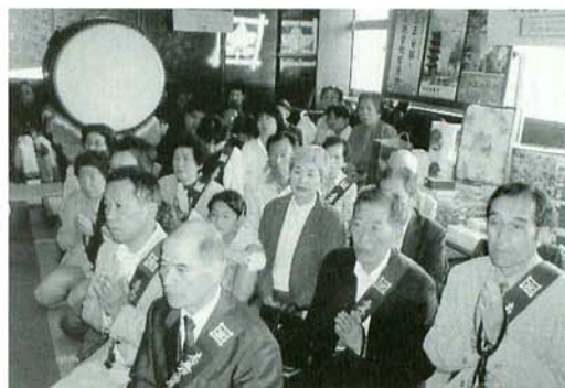
大黒尊天祭妙教寺の総代様達