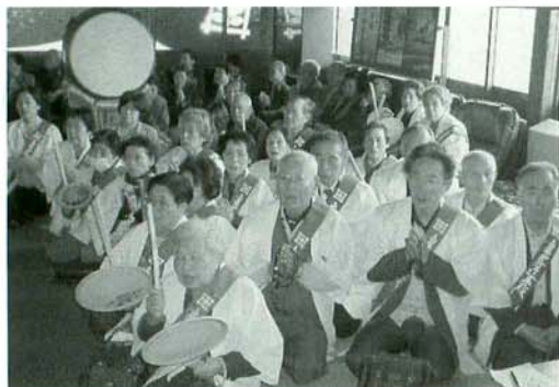
鬼子母神大祭参詣の檀信徒