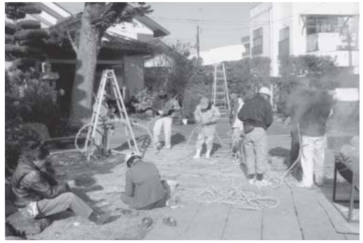
12/15 住連縄づくりに精を出す