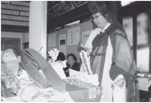
12/8 お炊きあげ祈禱する副住職