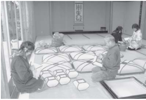
12/15 会館の蛍光灯もはずして