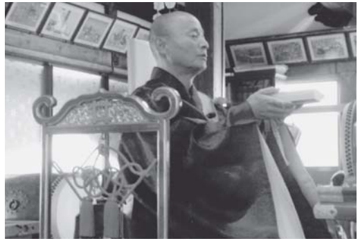
12/8 荒神大祭住職を導師として