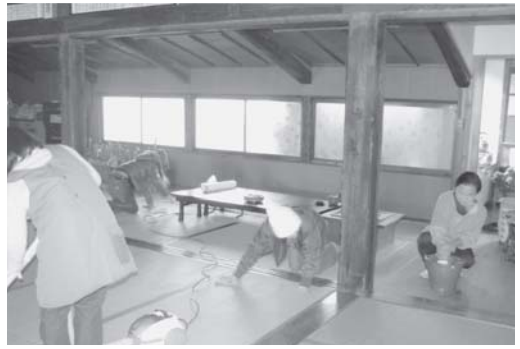
12/15 本堂は掃除機と空ぶきで