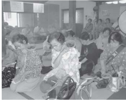
7/30 ほうろく灸をあてる檀信徒