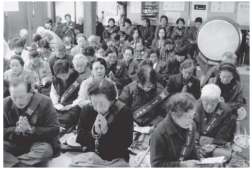
12/8 荒神大祭ご参詣の檀信徒