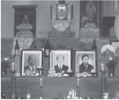
祭壇に並んだ3人の写真と位牌

た。妻の料理のせいなのか父の食欲は驚くほど旺盛でした。父は、お風呂が大好きでした。久原の家に連れてくると、のんびりとお風呂に入っていましたが、後になって父が自分では洗えなくなってきたとき、妻が懸命に洗ってあげていました。このように良く父の面倒を見てくれた妻に、私は感謝しています。しかし、さらに後になっていよいよ足が立たなくなってきたので、