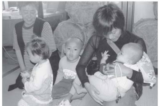
10/13 お会式参詣の子供たち