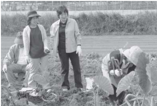
10/30 里芋を掘る名和上人ご夫妻ら