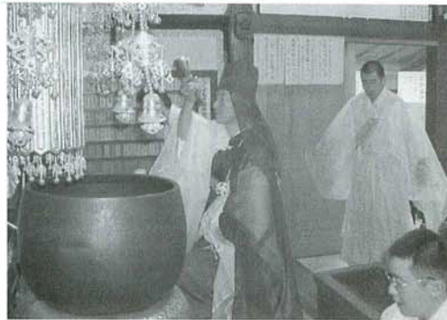
鬼子母神大祭の住職

出立もあとわずかに迫ってまいりましたので、誠に恐縮ですがお世話人様を通じ、最終の取りまとめをいただき、お世話人様不在の所は、當山法要の折ご納入下され