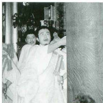
初行成満した副住職

満し、日蓮宗の修法師の資格を取得して、今般、圓頓寺に帰山し、法務に専従いたしておりました。が、出家得度以来、宗祖のご遺訓にある「行学の二道を励み候べし、行学たへなば仏法はあるべからず」（諸法実相抄）の御心を、己の、求道心に燃える心を内に秘め、道念堅固にて日夜研鑽精進してまいりました。