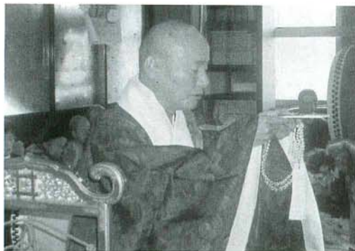
初講法要で特別祈禱する住職

我が宗門が、宗祖御降誕八百年にむかつて、新しい宗門運動を起こし、「立正安国・お題目結縁運動」と名づけて、僧・俗一致団結